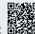
Sentiero didattico del ghiacciaio

Gita intelligente, un altro modo per scoprire il Vallese!