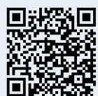
Sul sentiero dei massi erratici