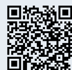
Sentiero del Bénou