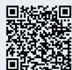
Sentiero ludico di La Creusaz