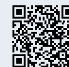
L'aria, elisir di vita